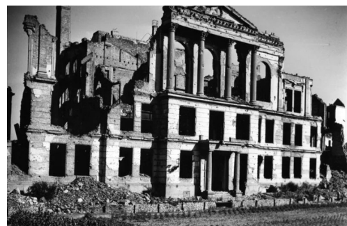
1951, Berlin, Ruine des Volksgerichtshofes in der Bellevuestraße

Außer vielleicht, dass es staatlich gefördertes und alimentiertes DENUNZiantentum gibt, das, wie im Dritten Reich, denen, die ihr insignifikantes Persönchen dadurch aufwerten wollen, dass sie anderen schaden, die Möglichkeit gibt, Arschkriechen mit Boshaftigkeit zu kombinieren.